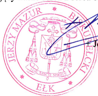
Jerzy Mazur SVD Biskup Ełcki

Na ten szczególny czas poruszający nasze serca z serca błogosławie.